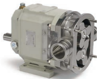
OMAC Drehkolbenpumpe Typ BB