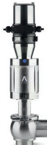
Regelventil Typ BBZK