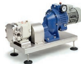
OMAC Drehkolbenpumpe Komplettlösung

Besuchen Sie uns auch im Internet: radotech.de