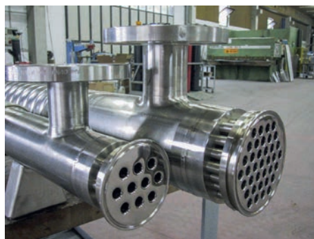
Wärmetauscher Pharmaindustrie Pharma Flo