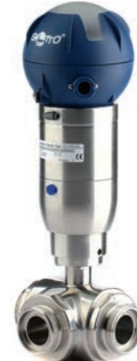
Kugelventil Typ ZVS