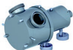
Pumpen nach dem Sinusprinzip