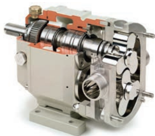
OMAC Drehkolbenpumpe Typ B

Auf Anfrage können wir die Pumpen mit Motor und Grundrahmen mit Kupplung ausstatten. Wir liefern auch mit Rollwagen oder Fahrgestell und Steuerschrank.