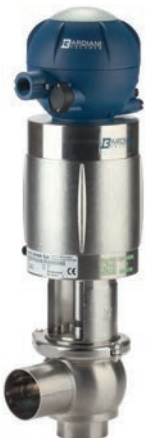
Aseptisches Ventil Typ BBYP