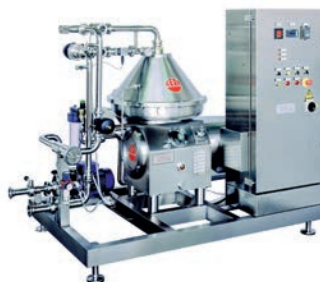
Zentrifuge für Bier