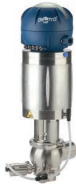
Doppelsitzventil Typ BZAW