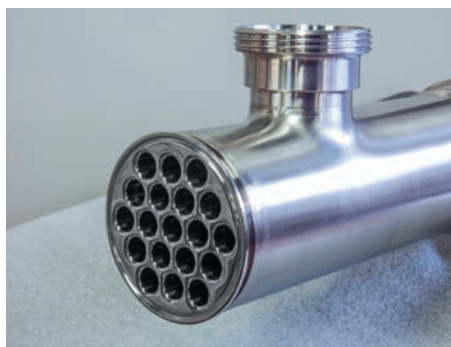
Wärmetauscher Molkerei und Getränke Mix Flo