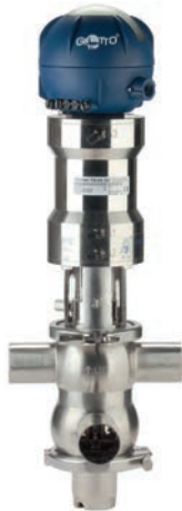
Doppelsitzventil Typ B925