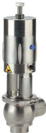
Überdruckventil Typ BBZS5