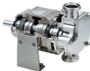
OMAC Drehkolbenpumpe Typ C/CF