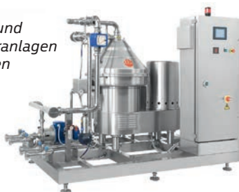
Zentrifuge für Wein