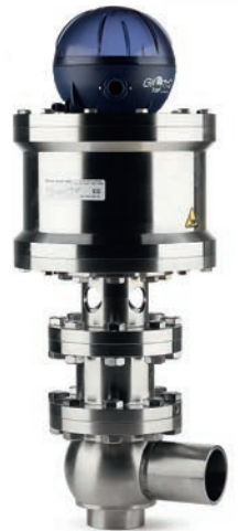
Hochdruckventil Typ BBYQ