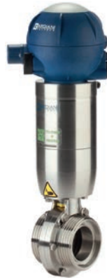
Scheibventil Typ ZVF