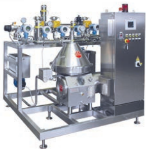
Zentrifugen und Standardisieranlagen für Molkereien

Spezialanbieter für Produkte zur Verarbeitung von Fruchtsaft, Tee und anderen Getränken. Die Produkte von REDA haben sich tausendfach bei unseren Kunden bewährt.